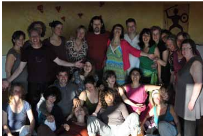
Didacta Modul 2 (November 2011)