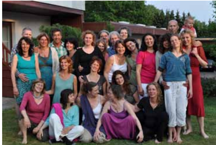
Didacta Modul 1 (Mai 2011)