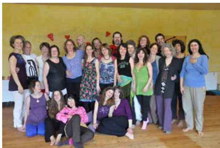
Didacta Modul 3 (Februar 2012)